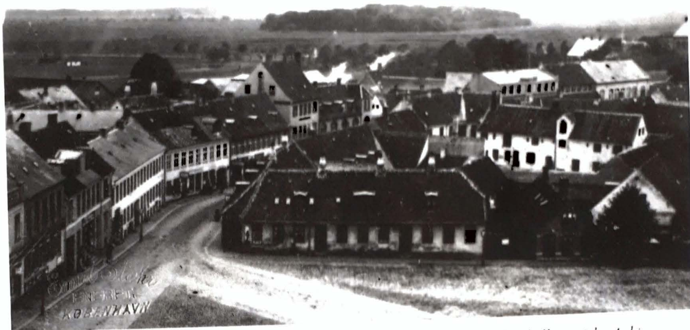
Torvet omkring 1890. Til venstre ses Bagergården, Slotsgade 1.