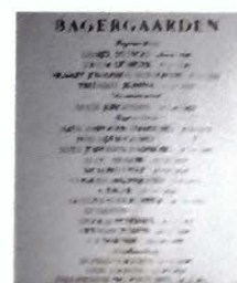
I porten i Bagergården, Slotsgade 1, er opsat en tavle med navne på stedets ejere gennem tiden.