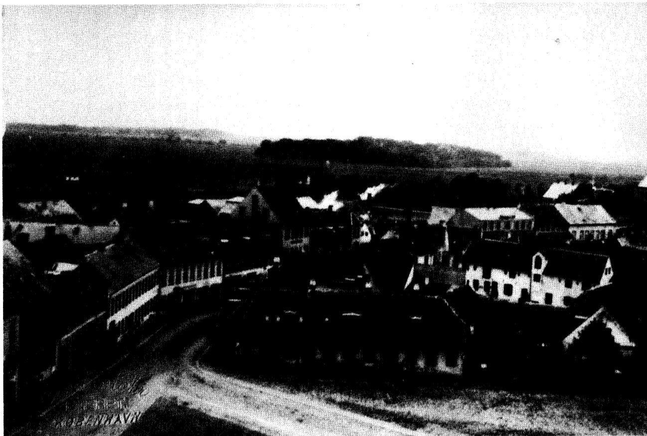
Torvet omkring 1890. Til venstre ses Bagergården, Slotsgade 1.