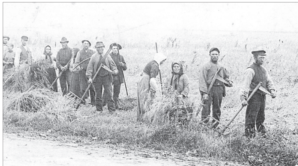
De store gårde krævede masser af menneskers arbejdskraft i 1800-tallet, som her ved høstarbejdet på Gaarbogaard i 1890. Blandt de lokale var der også en del svenske landarbejdere og nogle tyske.