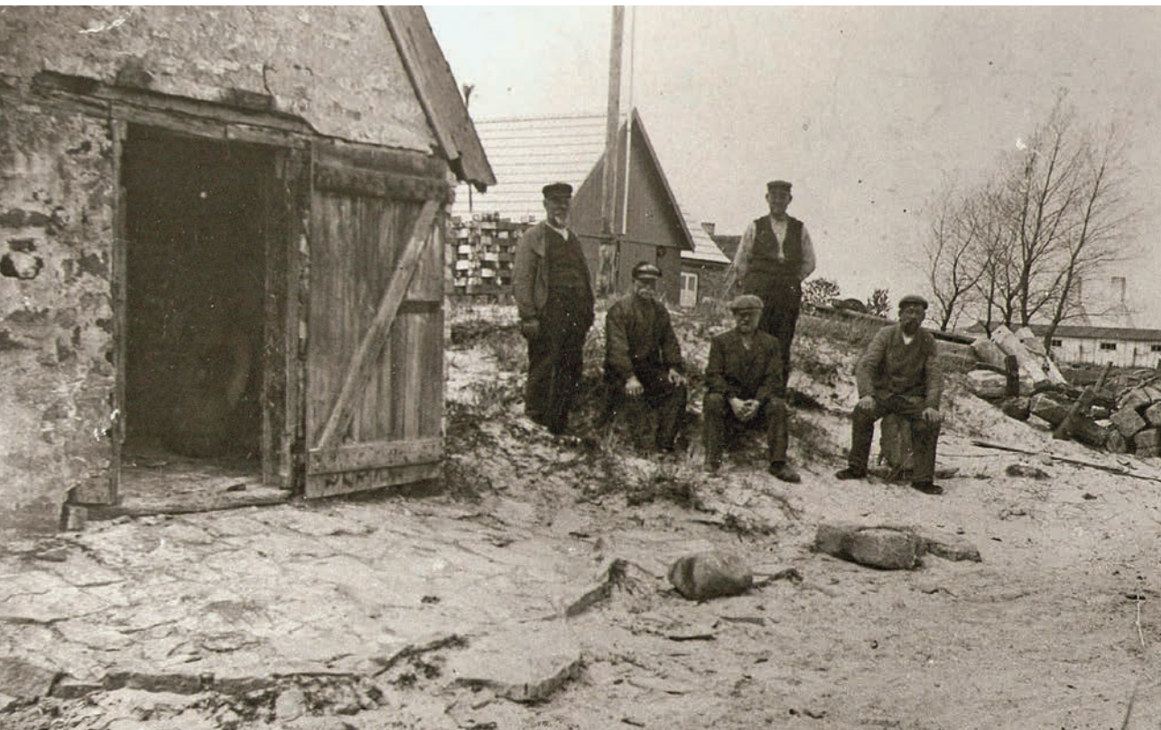
Havnebestyrelsen i Snogebæk 1917.