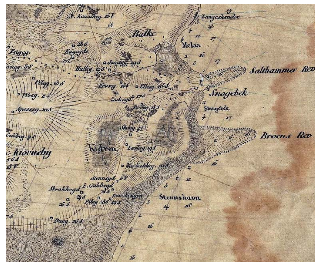
Udsnit af overadjutant Salchows søkort fra 1812 byggede på eksisterende kort, men suppleret med hvad der kunne ses langs kysten. Det er således det første kort, der med et anker markerer en havn i Snogebæk. Sandsynligvis den endnu synlige og i 2018 restaurerede sandstensmole lige syd for den nuværende havn. Det kongelige danske søkortarkiv, A 17/235 A.

Det ældste bevarede dokument i Snogebæks »byarkiv« er en verificeret kopi af et brev til kong Christian 8. fra 1845, hvor Snogebæk ret opsigtsvækkende påstod sig at være en gammel købstad med egne købstadsrettigheder. Når brevet overhovedet er bevaret skyldes det, at både dette aktstykke og en række efterfølgende breve, matrikelkort og grundejerlister daterede før 1889, var vældigt vigtige i samtiden. De var de eneste kendte oversigter der fortalte, hvem