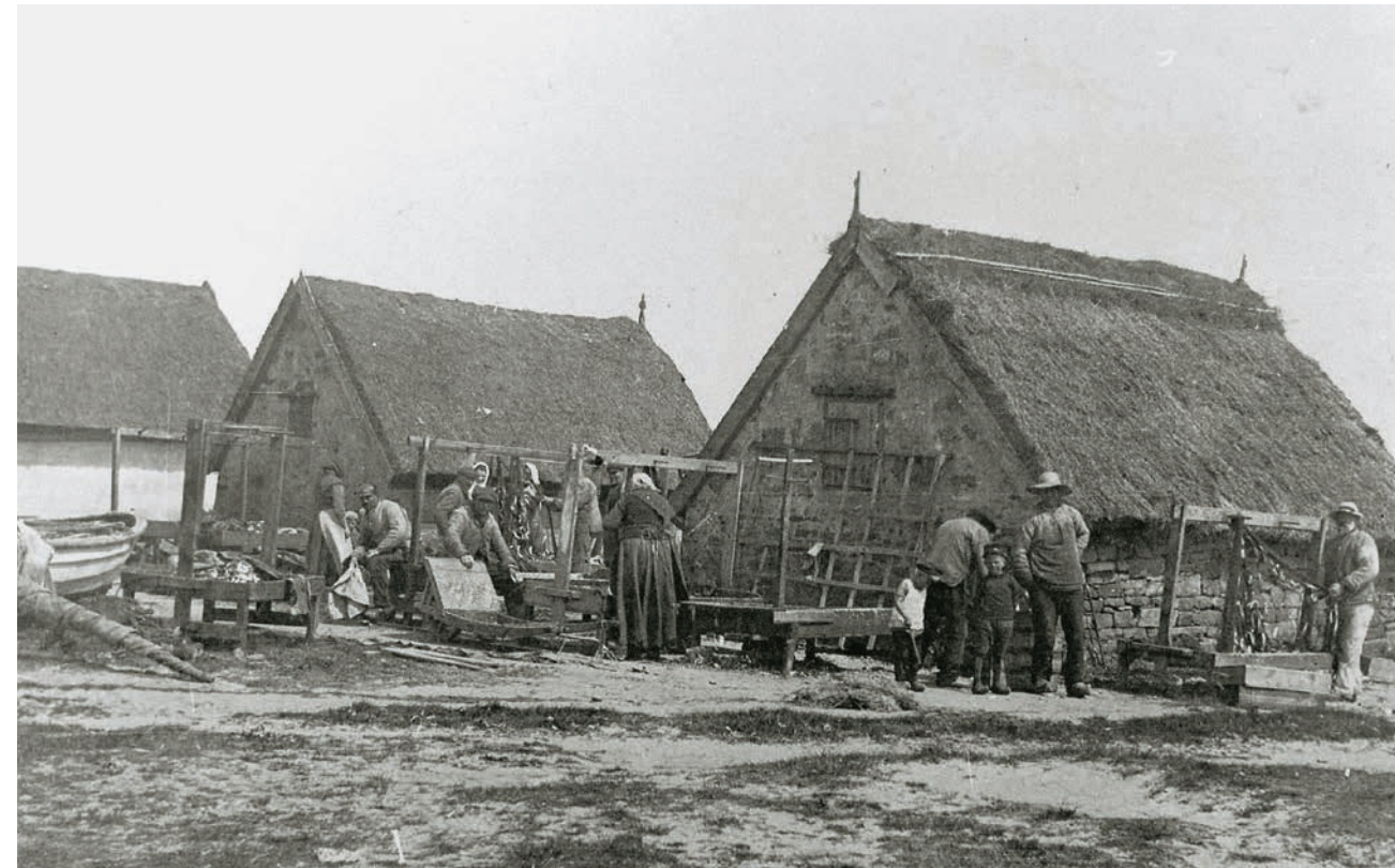
Pladsen over for redningsstationen ved udgangen til havnebroen, kaldet »Aage Pouls Hytte«, foto ca. 1900.

Dette rum på knapt en halv kilometer gav bønderne i Povlsker fri adgang til Hundesømosens sydlige tørveskær, men ikke fiskerne i Snogebæk. Grænsen mellem Snogebæk og Povlsker syd løb derimod, som foreslået fra hjørnet Tværvej/Tangvej. Den tang der i vore dage generer badegæsterne, var dengang en efterspurgt og omstridt ressource.