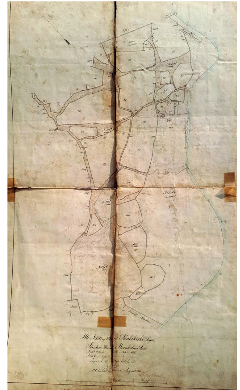
Bilag til kongebrevet af 30.12.1861 der angiver omfanget af Snogebæk. Fra Krogen i Nord til lidt syd for Tværvej i syd og Smedevej mod vest. Af veje genkendes bl.a. Hovedgade og Ellegade.