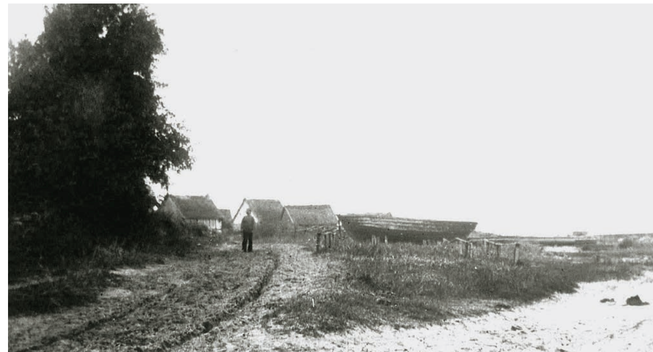
Østligste del af Hovedgaden i Snogebæk ved den gamle sandstensmole. I baggrunden til højre skimtes broen til den ny havn fra 1889.

Regeringen havde ellers i århundreder uden synderligt held søgt at dæmpe sandflugten langs landets mest udsatte kyster, men blev netop modarbejdet af nedarvede »græsningsrettigheder«. For Bornholms vedkommende var der fra først af særligt tale om det mindre område mellem Rønne og Hasle, men det gik langsomt og da Rønne købstad i 1819 nægtede at deltage i arbejdet udtalte strandfoged Jespersen: »Udmarkerne er bornholmernes kæphest. At fratage dem retten til at skamsulte deres